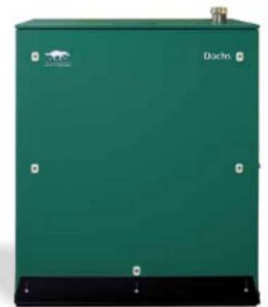
Dachs Pro 20