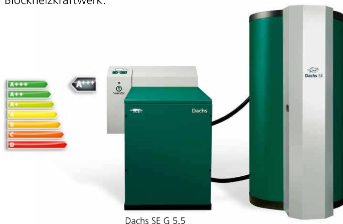
Dachs SE G 5.5

Für die Versorgung von Mehrfamilienhäuser ab 3 Wohneinheiten eignet sich der Dachs ideal. Sie erzeugen bis zu 70 Prozent des Stroms und 90 Prozent der Wärme verbrauchsnahe und nahezu verlustfrei im Objekt selbst. Der Dachs Pro 20 mit 19,2 kW elektrischer und 42 kW thermischer Leistung eignet sich vor allem zur Deckung des Grundbedarfs von ganzen Wohnkomplexen, Hochhäusern und großen Mehrfamilienhäusern. Beide Systeme lassen sich in jedes Heizungssystem integrieren und liefern intelligent und komfortabel Strom und Wärme für die Mieter bzw. Eigentümer. Bereits mehr als 35.000 zufriedene Kunden vertrauen auf den Dachs. Der Dachs ist damit Europas meistverkauftes Blockheizkraftwerk.